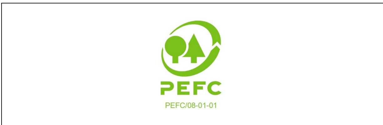
Obr. 10.1 Logo PEFC

PEFC ochranné známky se používají na základě oprávnění k používání PEFC ochranných známek, které vydává Rada PEFC nebo PEFC autorizovaný orgán. Licence se získá podpisem licenční smlouvy (smlouva o používání ochranných známek) mezi organizací žádající o používání ochranných známek a Radou PEFC nebo PEFC autorizovaným orgánem. PEFC Česká republika je na základě smlouvy autorizovaný orgán, který má povolení od Rady PEFC vydávat licence jménem Rady PEFC v České republice.